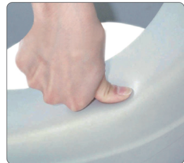
柔らかで座り心地のよい座面