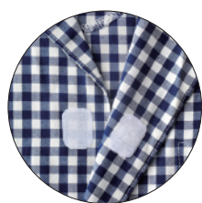
面ファスナー(マジック式)