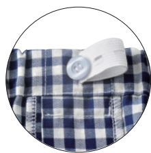
ウエスト調整ゴム