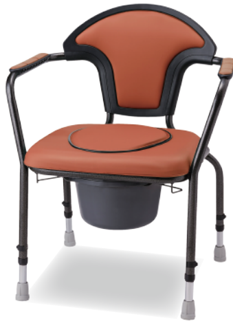
テラコッタレッド