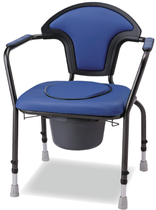
オーシャンブルー