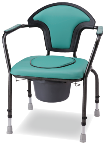
エメラルドグリーン