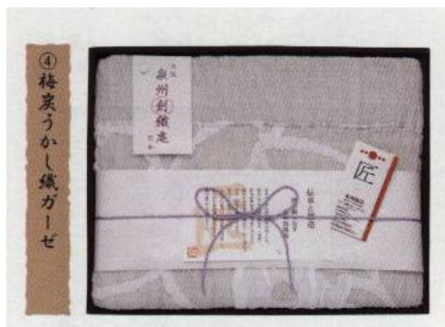
※紀州南高梅炭を練りこんだ 消臭性のあるガーゼケット

洗えるからいつも清潔。3層ガーゼケットは、洗濯にも強く 洗えば洗うほどガーゼ本来の 柔らかさが生まれ ふわふわした綿の柔らかさが出るので、 デリケートなお肌にも快適 です。 この綿状の特殊な糸は脱水性に優れているため、天気の良い日であれば天日で半日程 度で乾きます。