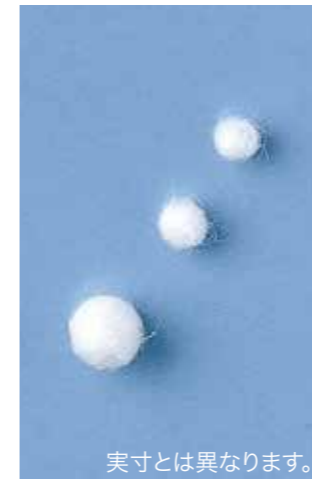
実寸とは異なります。