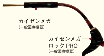
カイゼンメガ (一般医療機器)