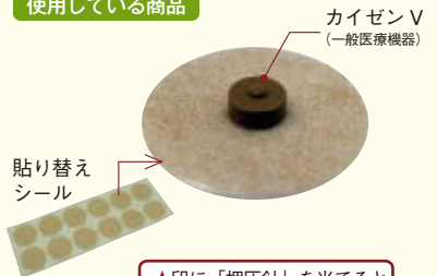
カイゼンV (一般医療機器)