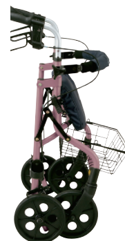
折りたたみ時 (自立可能)