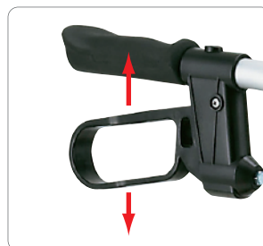
お買物に便利なフック付きです。 (最大1kgまで)