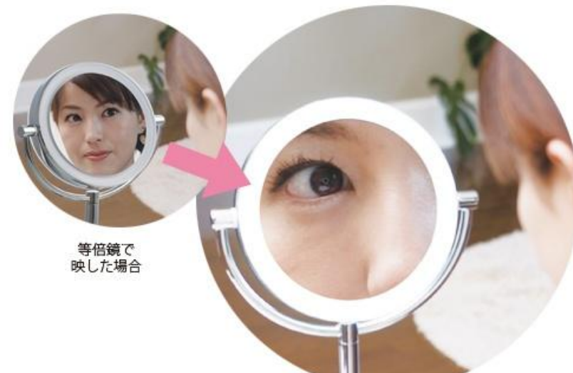
等倍鏡で 映した場合