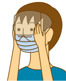
シールドのスリットを顔の側面に合わせて折ります。